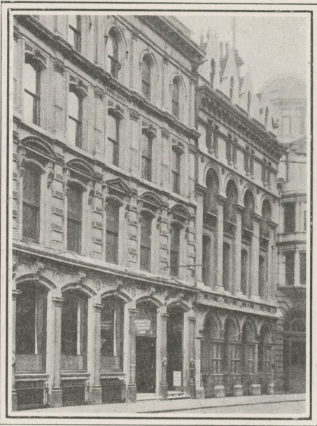
GUARANTY TRUST COMPANY OF NEW YORK SUCCURSALE DE LONDRES

Succursales { LONDRES, 32, Lombard Street E. C. PARIS, 1 & 3, rue des Italiens.