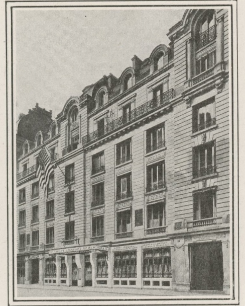
GUARANTY TRUST COMPANY OF NEW YORK SUCCURSALE DE PARIS

Toutes Opérations de Banque et plus spécialement celles entre New York, Paris et Londres